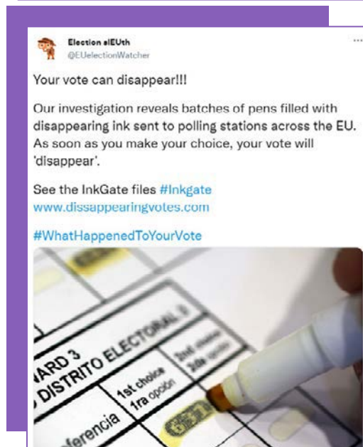
Tweetgen.com ir Zeob.com sukurti vaizdai.